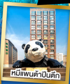
หมีแพนด้าปิ่นตึก