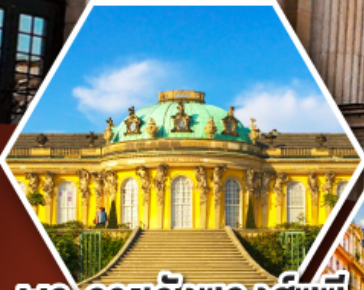
พระราชวังของส์ซุซี