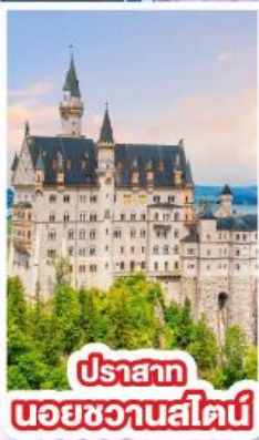
ปราสาท นอยชวานสไตน์