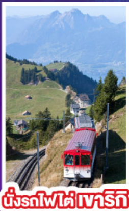
นั่งรถไฟใต้เขาริกิ