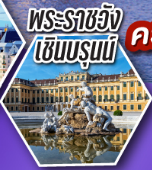
พระราชวัง เซินบรุนน์