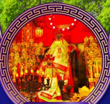
วัดเจ้าแม่กวนอิม ฮองฮ่า