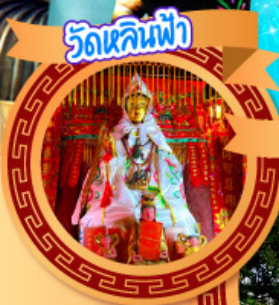
วัดหลินฟ้า

สนุกสนานไปกับดินแดนสุดทรรษาแบบเต็มวัน "ดิสนีย์แลนด์" ชมจุดชมวิวฮ่องกงแบบพาโนรามาจากยอดเขาวิคตอเรียพีค นึ่งกระเช้านองปิงสักการะพระใหญ่เทียนถาน