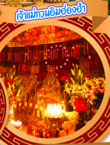
เจ้าแม่ทวนอิมฮ่องกง

05-08, 17-20 ต.ค., 31 ต.ค.-03 พ.ย.67 02-05, 07-10, 14-17, 16-19 พ.ย.67 21-24 พ.ย., 28 พ.ย.-01 ธ.ค.67