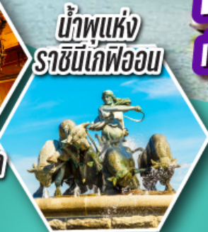
น้ำพุแห่ง ราชินีเดฟวอน

ค้างคืนบนเรือสำราญ 2 ลำ เรือสำราญ TALLINK SILJA LINE และ เรือสำราญ DFDS