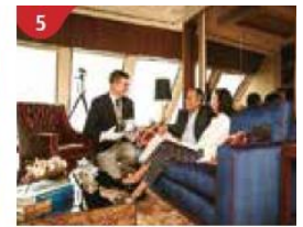
5 The Palace Indulge in European-style butler service and exclusive facilities.