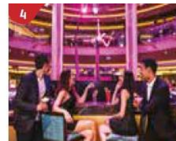
4 Bar 360 Catch live music and aerial acrobatic performances with a glass of champagne.