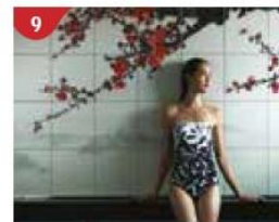
9 Crystal Life™ Spa Rejuvenate mind, body and soul with our holistic Western and Asian spa experience.