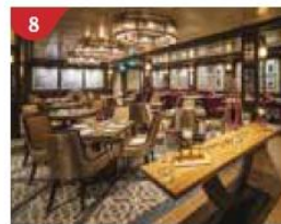
8 Bistro By Mark Best Relish contemporary Western cuisine from the internationally-acclaimed Australian chef.