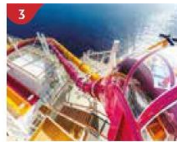
3 Waterslide Park Get drenched in fun on one of our six different waterslides.