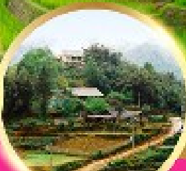
หมู่บ้านก๊อตก๊ต