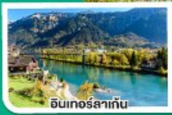
อินเทอร์ลาเก็น