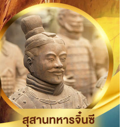
สุสานทหารจีนซี