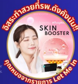
อิสระทำสวยที่พ.ดังคังนัม!! คุณงามความดี Let Me In