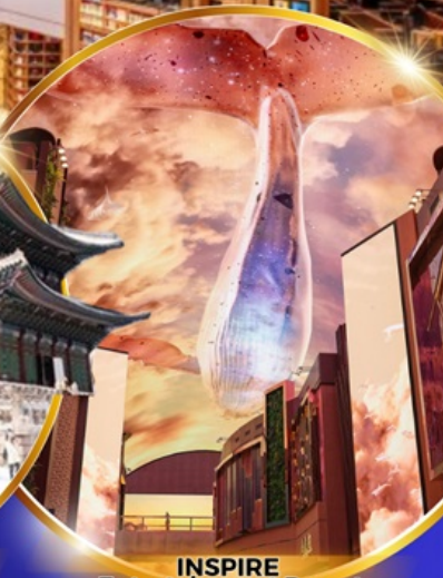
INSPIRE Entertainment Resort