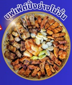
บุฟเฟ่ต์ปิ้งย่างไม่อั้น