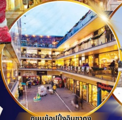
ถนนช้อปปิ้งอินชาง

ใหม่!! ห้องสมุดสุดอลังการที่ชวอน ชมจอ LED เสมือนจริงขนาดยักษ์ สนุกสุดมันส์ที่สวนสนุกเอเวอร์แลนด์ ชมพระราชวังเคียงบอกคุง ถนนวัฒนธรรมอินชาง อิสระช้อปปิ้งคังนัม เมียงดง Lotte Duty Free