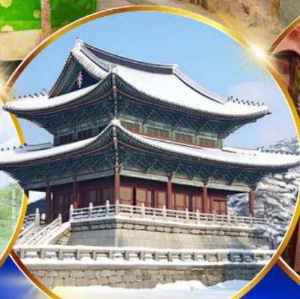
พระราชวังเคียงบกคยอง