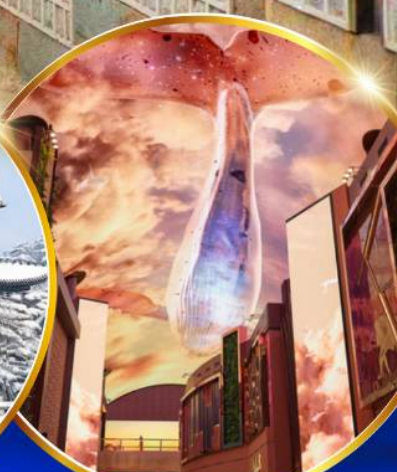
INSPIRE Entertainment Resort

ชมจอ LED ขนาดยักษ์ที่รีสอร์ท 5 ดาว ใหญ่ที่สุดในเอเชียเหนือ ชมพระราชวังคยองบกคยอง ย้อนอดีตหมู่บ้านบุคซอน อันอก ใส่ชุดฮันบก ทำข้าวห่อสาหร่าย อิสระช้อปปิ้ง Lotte Duty Free