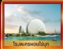
โรงละครหอยไข่มุก