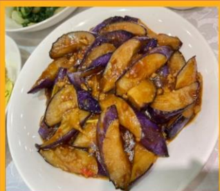
มะเขืออบหม้อดิน