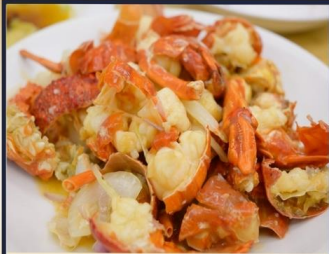
กุ้งมังกรอบซีส