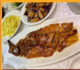
ท่านอย่าง