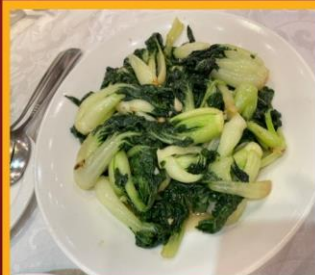
ผัดผักตามฤดูกาล