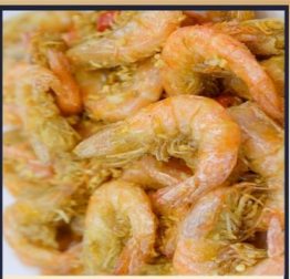
กุ้งทอดกระเทียม