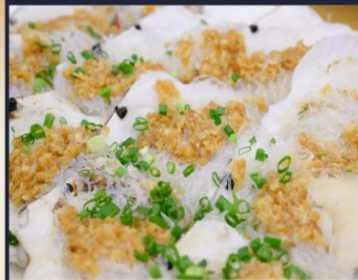
หอยเชลล์อบวุ้นเส้น