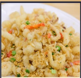
หมึกทอดกระเทียม