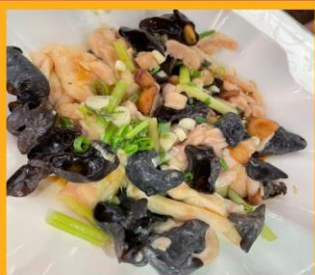
ไก่ผัดเห็ดหูหนู