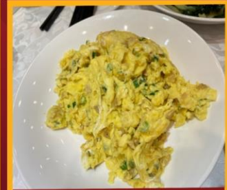
ไข่เจียวทรงเครื่อง