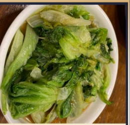
ผัดผักตามฤดูกาล