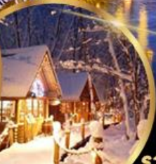
หมู่บ้านเทพนิยาย นิงเกิลเทอเรส