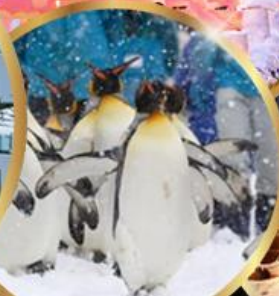
สวนสัตว์ อาซาฮิยาม่า