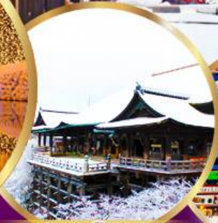
วัด คิโยมิสึ