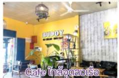
Cafe ใกล้จุดลงเรือ