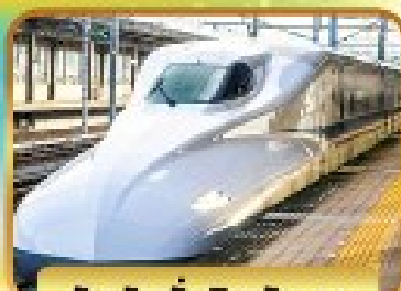
สัมผัสบั้งซิบกันเซน