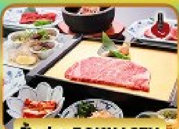
บั้งย่าง ROKKASEN