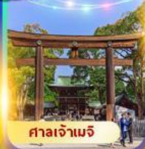
ศาลเจ้าเมจิ