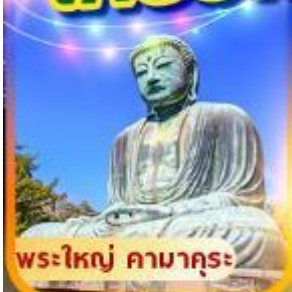
พระใหญ่ คามาคุระ