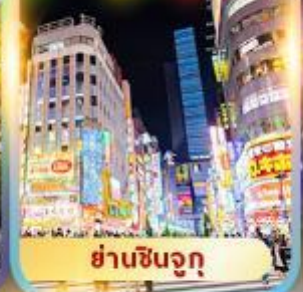
ย่านชินจูกุ