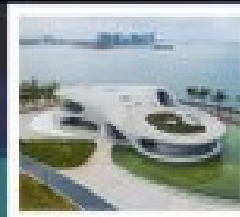
หอนาฬิกา