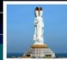
เจ้าแม่กวนอิมทะเล