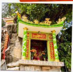
ศาลเจ้าตึงซา