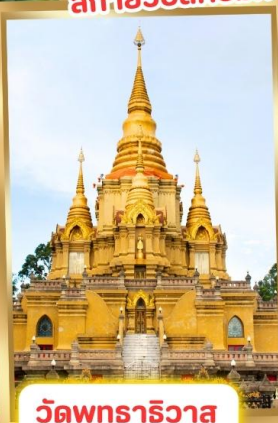
วัดพุทธาริวาส