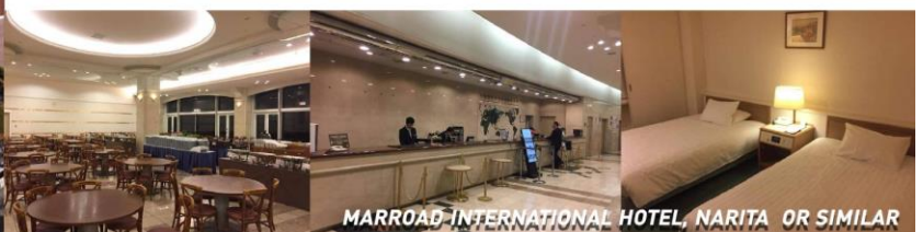
MARROAD INTERNATIONAL HOTEL, NARITA OR SIMILAR