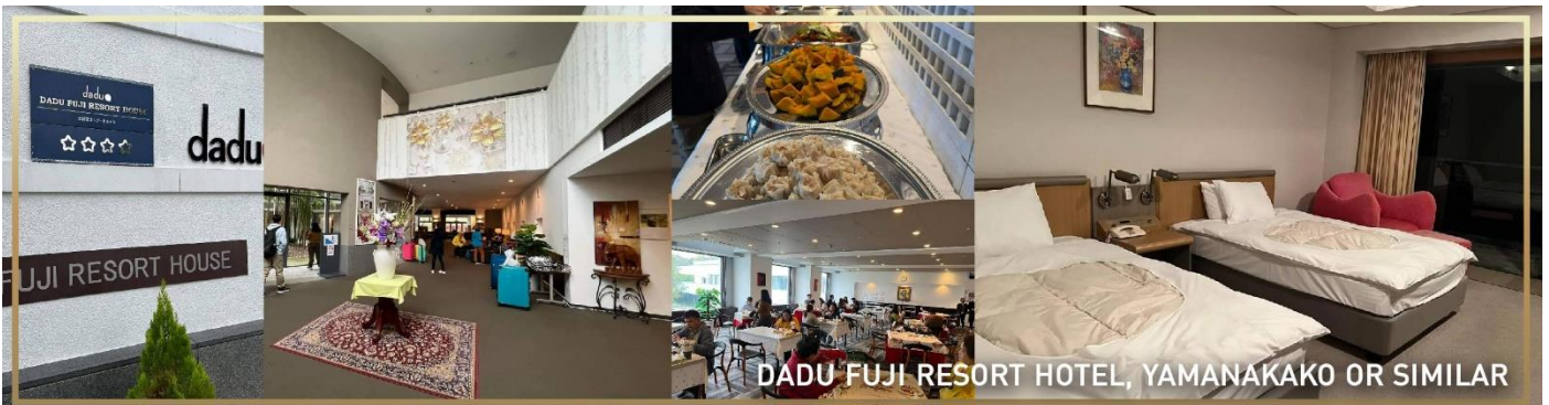
DADU FUJI RESORT HOTEL, YAMANAKAKO OR SIMILAR