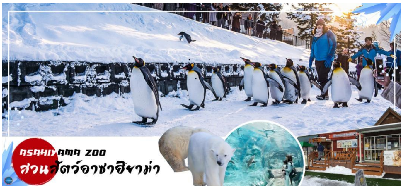
ASAHIYAMA ZOO สวนสัตว์อาซาฮิยาม่า

วันที่สี่ เมืองอาซาฮิกาวา – สวนสัตว์อะซาฮิยาม่า – หมู่บ้านราเมงอะซาฮิยาม่า – เมืองฟูราโนะ – ลานสโนว์ เวิลด์ (กิจกรรมทางหิมะ) – เมืองซัปโปโร – ย่านซูซุกิโนะ