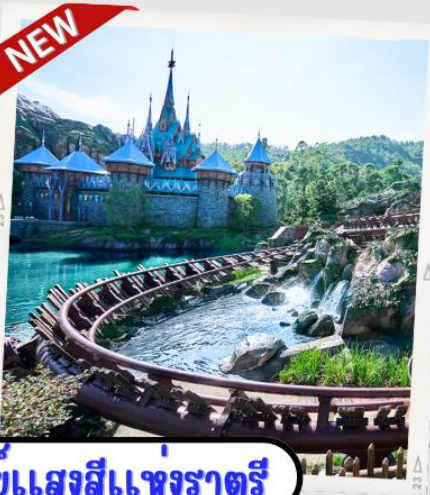
“MOMENTOUS” มหึศจรรย์ขแสงสีแห่งราตรี