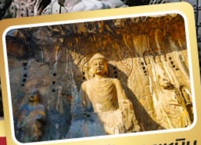
ฟาแคะสลักหลงเหมิน