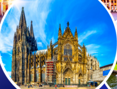
มหาวิหารแห่งโคโลญ หมู่บ้านกังธูร์น