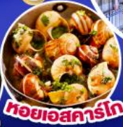
หอยเอสคาร์โก