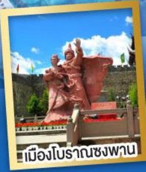
เมืองโบราณชงพาน