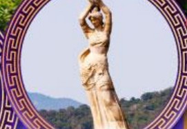
จูไห่พิพิธภัณฑ์