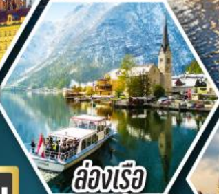
ล่องเรือ ทะเลสาบอัลสติก