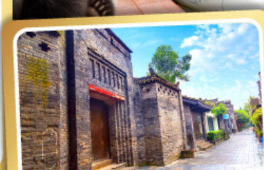
ถนนคนเดินชอยกว้างชวยแคบ