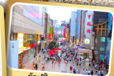
ช้อปปิ้งถนนซีลชีลู