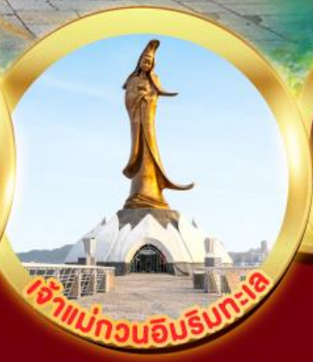
เจ้าแม่กวนอิมริมทะเล