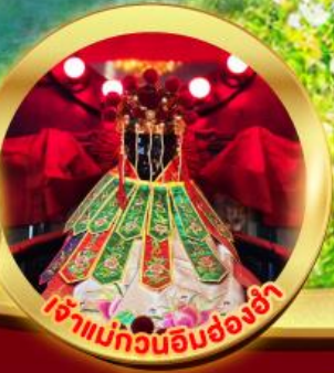
เจ้าแม่กวนอิมฮ่องฮ่า