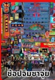
ช้อปจิมซาจุ้ย