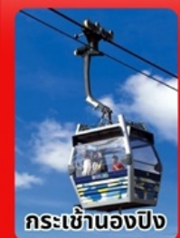
กระเช้านอ้องปีง