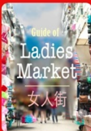
Guide of Ladies Market 女人街