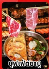
บุฟเฟต์ซาบู