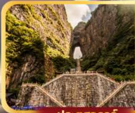
ประตูสวรรค์