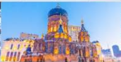
โบสถ์เซนต์ไอเซเฟีย