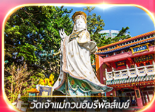
วัดเจ้าแม่กวนอิมรพาสลีย์