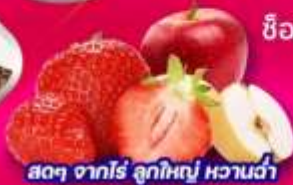
สดๆ จากไร่ ลูกใหญ่ หวานฉ่ำ

เล่นสกีที่ลานสกี • สนุกสนานกับการตกปลาน้ำแข็ง • ซิมปลาเทราส์แล่สด ขอฟรที่วัดพงอินชา • คลองกฤษแจ N Tower • เล่นเครื่องเล่นที่สวนสนุกเอเวอร์แลนด์ ชมคลองชองเกซอน • Coex mall • ห้องสมุดสุดชิค Starfield Library ช็อปปิ้งตลาดเมียงดง • ตลาดซองแด • ย่านยอนนัมดง • Hyundai shopping outlet