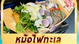
หม้อไฟทะเล