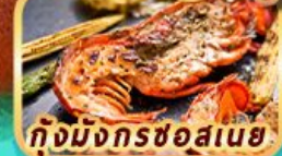
กุ้งมังกรชอสนาย