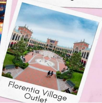
Florentia Village Outlet