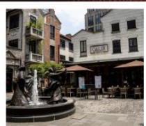
ซินเทียนตี้