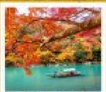
ฮาชิมาตะ