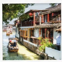
เมืองโบราณจู่เจียเจี๋ย