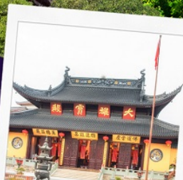
วัดพระหยก