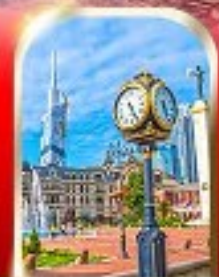
BATUMI CITY ADJARA

เมืองถ้ำอูปลิสซิคะ ■ ป้อมนาบูซี ■ นั่งกระเช้าชมเมืองบอร์โจมี