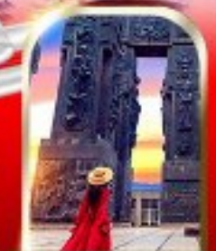
THE CHRONICLE OF GEORGIA