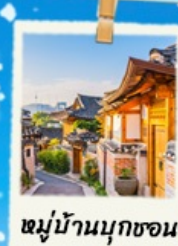
หมู่บ้านนุกซอน