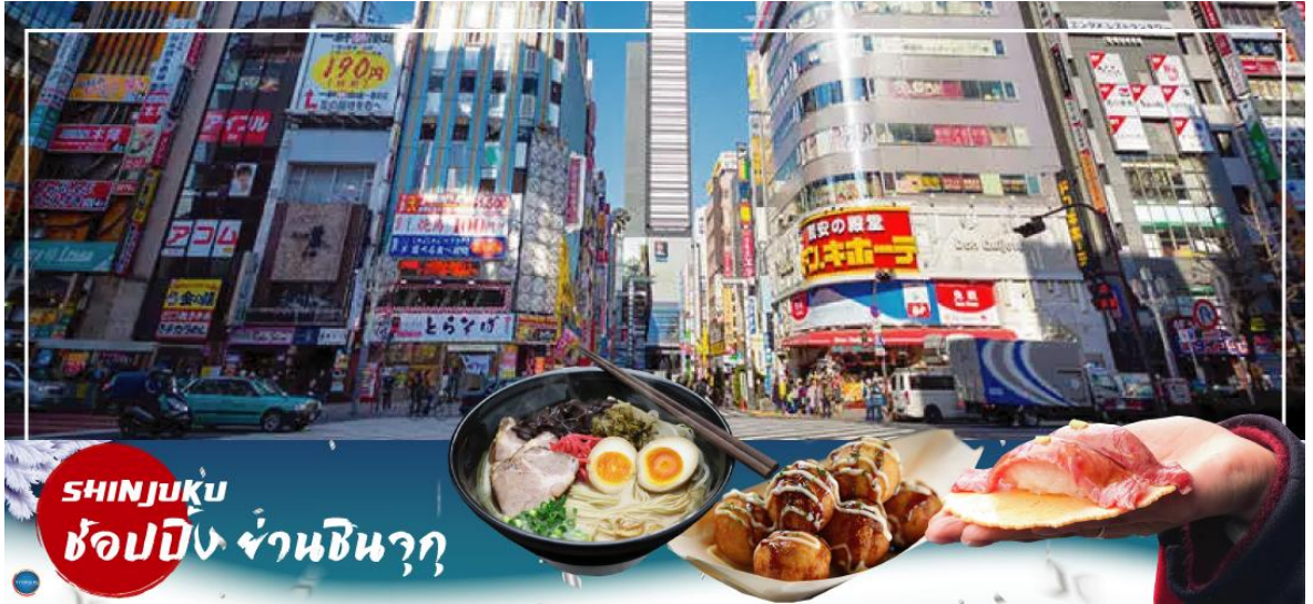
SHINJUKU ช้อปปิ้ง ย่านชินจูกุ

นำท่านช้อปปิ้ง ย่านชินจูกุ (Shinjuku) ให้ท่านอิสระและเพลิดเพลินกับการช้อปปิ้งสินค้ามากมาย ทั้งเครื่องใช้ไฟฟ้า กล้องถ่ายรูปดิจิตอล นาฬิกา เครื่องเล่นเกม หรือสินค้าที่จะเอาใจคุณผู้หญิงด้วย กระเป๋า รองเท้า เสื้อผ้า แบรินด์เนม เสื้อผ้าแฟชั่นสำหรับวัยรุ่น เครื่องสำอางยี่ห้อดังของญี่ปุ่นไม่ว่าจะเป็น KOSE, KANEBO, SK II, SHISEDO และอื่นๆ อีกมากมาย ห้ามพลาด!!! จุดเช็คอินแห่งใหม่ ของชาวโซเชียล นั่นก็คือ แมวยักษ์ 3 มิติ ที่โผล่บนจอแอลอีดีมีขนาดมหึมา จอมความโค้งขนาด 154 ตารางเมตร (1,664 ตารางฟุต) เสียงที่ออกจากลำโพงคุณภาพเกรดดี ความละเอียดภาพระดับ 4K ถือเป็นเทคโนโลยีระดับสูง ที่ให้ภาพเสมือนจริงปรากฏเป็นภาพแมวเหมียวเดินเล่นไปมาอยู่เหนือกรุงโตเกียว นอกจากแมวยักษ์แล้ว ท่านยังสามารถรับชมโฆษณาต่างๆ ที่ถูกครีเอทให้เป็นภาพ 3 มิติ ผ่านจอแอลอีดีนี้ ไม่ว่าจะเป็น แพนด้า, รองเท้าไนกี้, น้องหมา Pompompurin, จานบิน UFO แม้แต่หุ่นยนต์เครื่องดูดฝุ่น ท่านสามารถรับชมและเก็บภาพได้ตามอัธยาศัย