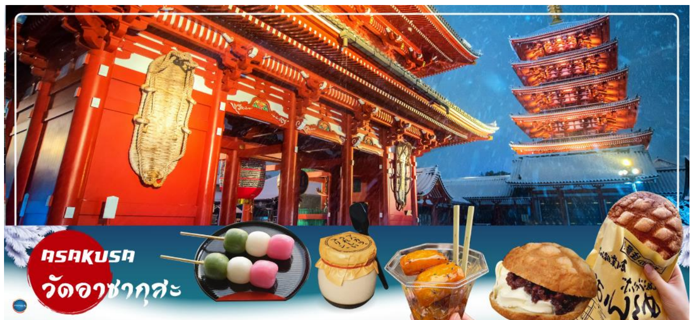
ASAKUSA วัดอาซากุสะ

กรุงโตเกียว – วัดอาซากุสะ – ช้อปปิ้งถนนนากามิเสะ – ถ่ายรูปโตเกียวสกายทรีริมแม่น้ำสุมิดะ – พระราชวังอิมพีเรียล(ด้านนอก) – สะพานแวนดา – ย่านโอไดบะ – ห้างไดเวอร์ซิตี