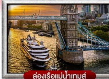
ล่องเรือแม่น้ำเทมส์