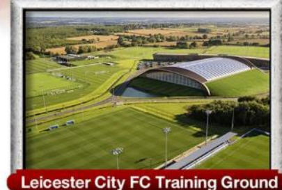
Leicester City FC Training Ground

พิเศษ!! เมนู เบอร์เกอร์ต้นตำรับ & กุ้งลือบสเตอร์ และ เปิดย่างไฟร์ชิลีน