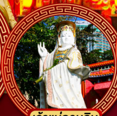
เจ้าแม่กวนอิม รีพัลส์เบย์