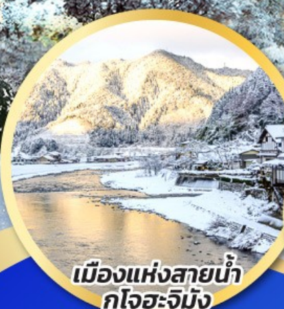
เมืองแห่งสายน้ำ กุโจะจิมัง