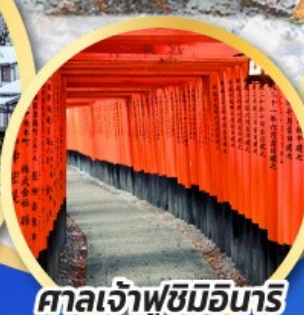
ศาลเจ้าฟุชิมิอินาริ