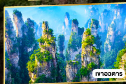
เวาอวดาร