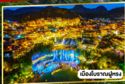
เมืองโบราณฝูหลง

เฟิ่งหวง ฝูหลงเจิ้น มนตร์งลิ่งแห่งขุนเขา และเมืองโบราณ 5 วัน 4 คืน