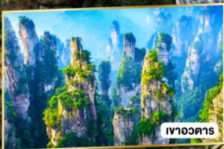
เวาอวดาร