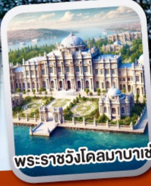
พระราชวังโดลมาบาเช่